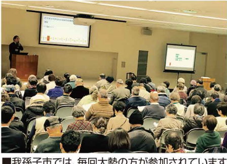
■我孫子市では、毎回大勢の方が参加されています

ちいき新聞(以下、ち) 初の800名規模での大型開催ですが開催の経緯を教えてください。